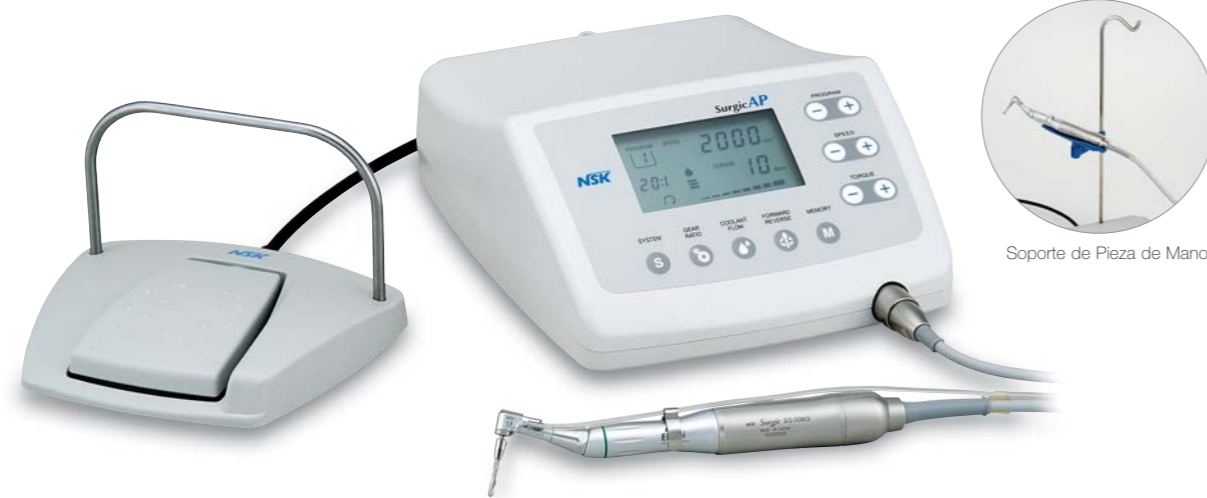
Soporte de Pieza de Mano

Surgic AP No Óptico Set Completo Con Pieza de Mano SGM-ER20i