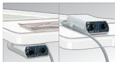
Debajo ó Sobre el panel de instrumentos