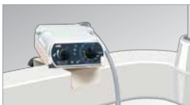
Con Soporte (opcional) sobre el brazo del panel de instrumentos