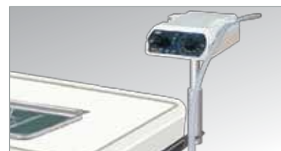
Detrás del panel de instrumentos con el Brazo de Montaje (opcional)