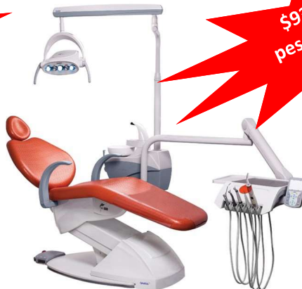
Unidad equipada G3 New F Gnatus