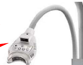
Lampara para Blanquimiento modelo LBP2 para unidad dental