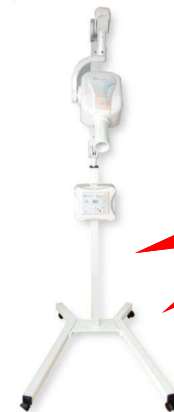
Rayos X PrimeXray de 70 Kvps y disparador inalámbrico