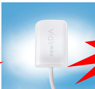
Radiovisógrafo New IDA Eagle DabiAtlante