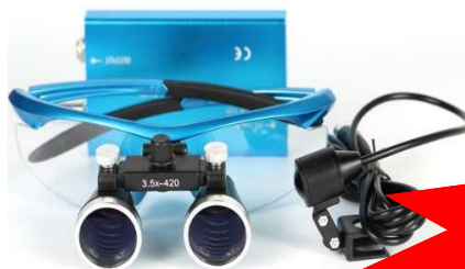
Kit de lupas quirúrgicas 3.5X con luz LED y maletín