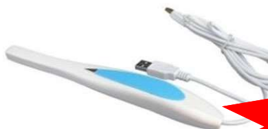
Cámara intraoral con ¼ Sony super HAD CCD