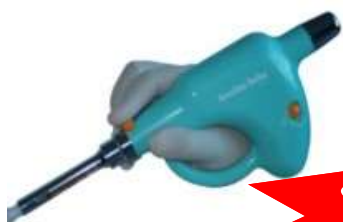
Sistema electrónico de suministro de anestesia