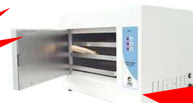
Esterilizador modelo ED 18 marca Caisa