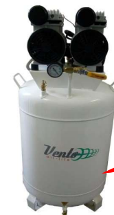
Compresor libre de aceite 2 HP y 72 Lts. semi-silencioso marca Vento